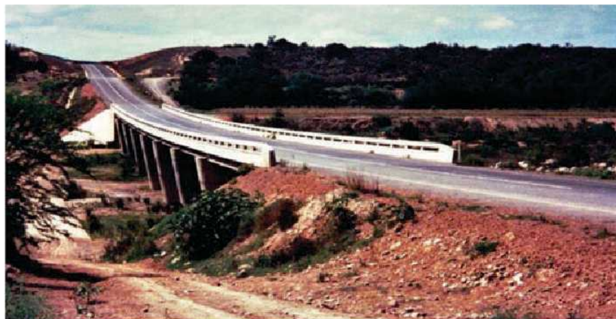
Gouritsrivier-brug by Die Poort

'n Alternatiewe teerpad is wel agterna gebou vanaf die R62 oor die Garciapas tot in Riversdal.